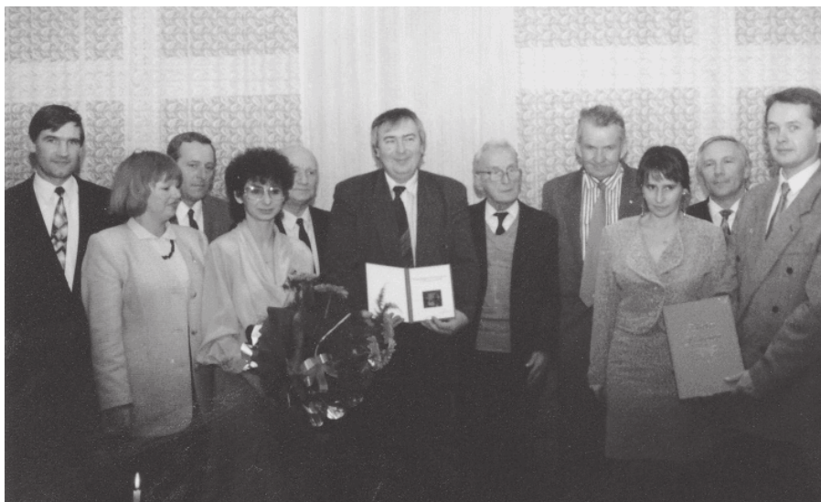
5. 1995 - XX - lecie Szkolnego Związku Sportowego w Czeladzi

W tej formie organizacyjnej SZS w Czeladzi działał jeszcze przez rok.