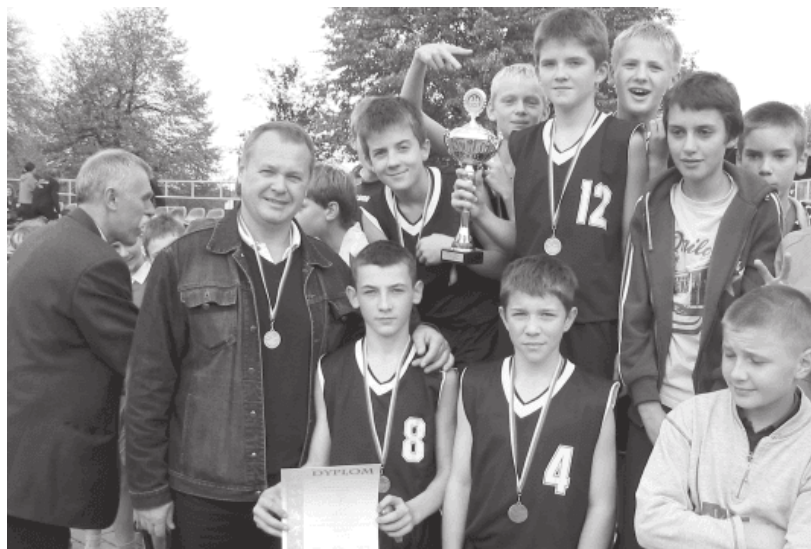
38. 2008 rok – 1 miejsce sztafetowe biegi przelajowe zespołu z SP 2.