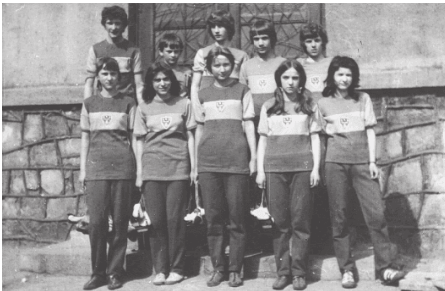
21. Zespół lekkoatletów z SP 8