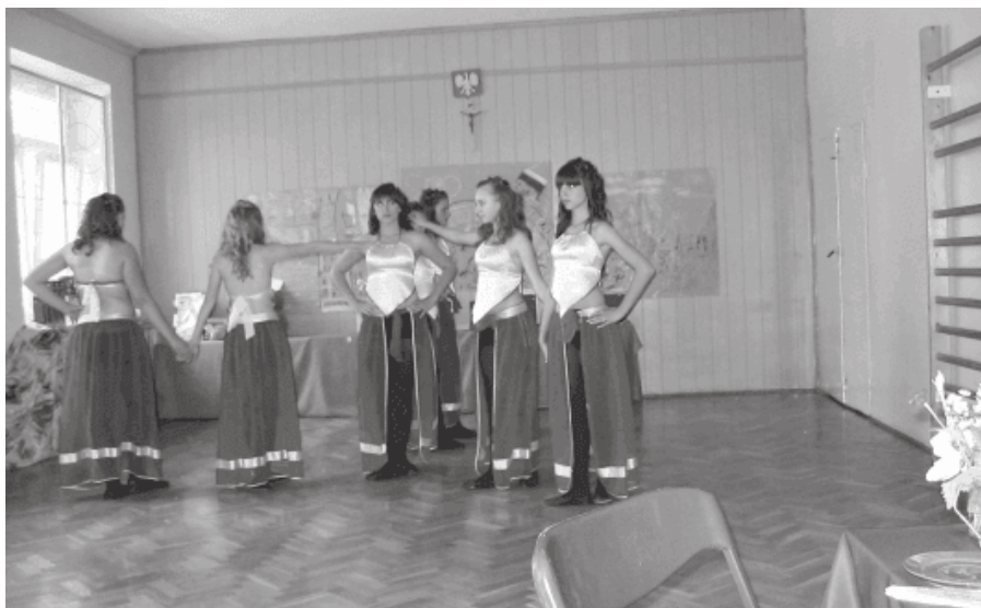
17. 2008 rok - Walny Zjazd MSZS występ zespołu z SP 7

Zebranie sprawozdawczo-wyborcze zatwierdziło cele i kierunki, które obecnie realizujemy.