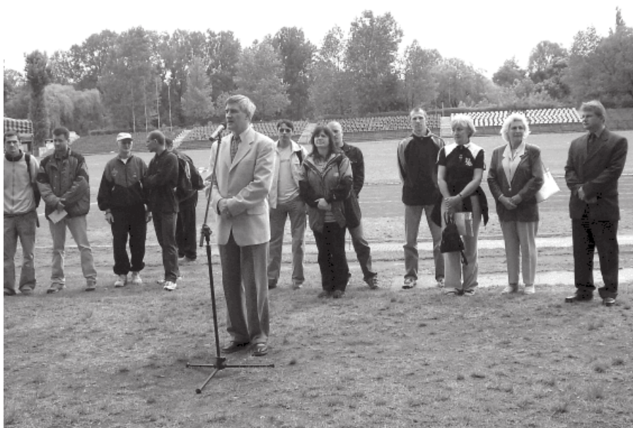
8. 2005 rok - Biegi przełajowe im. Edwarda Maczugi