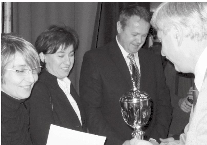
31. 2007 rok – 11 miejsce we współzawodnictwie o Puchar Śląskiego Kuratora Oświaty.