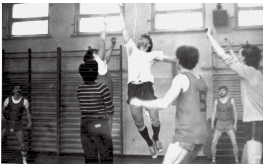
23. Zawody koszykówki w LO w Czeladzi