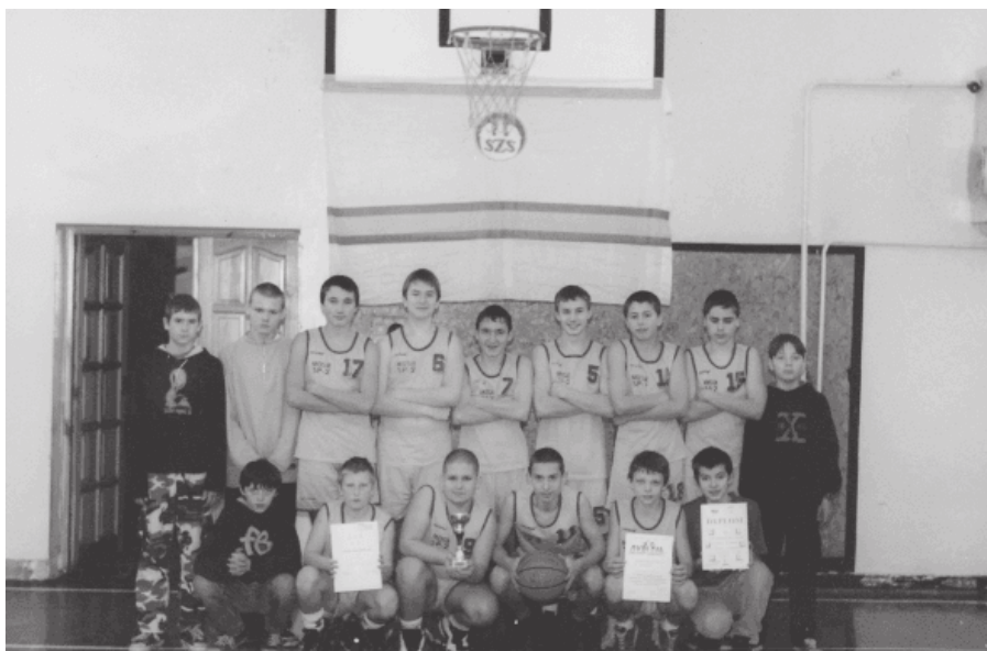
28. 2000 rok - 4 miejsce w koszykówce zespołu z SP 2