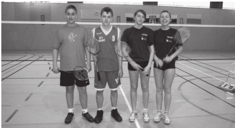
42. 2010 rok – 4 miejsce zespół badmintonistek i badmintonistów z G 1.

Rywalizacja roku szkolnym 2009/10 nie dobiegła końca.