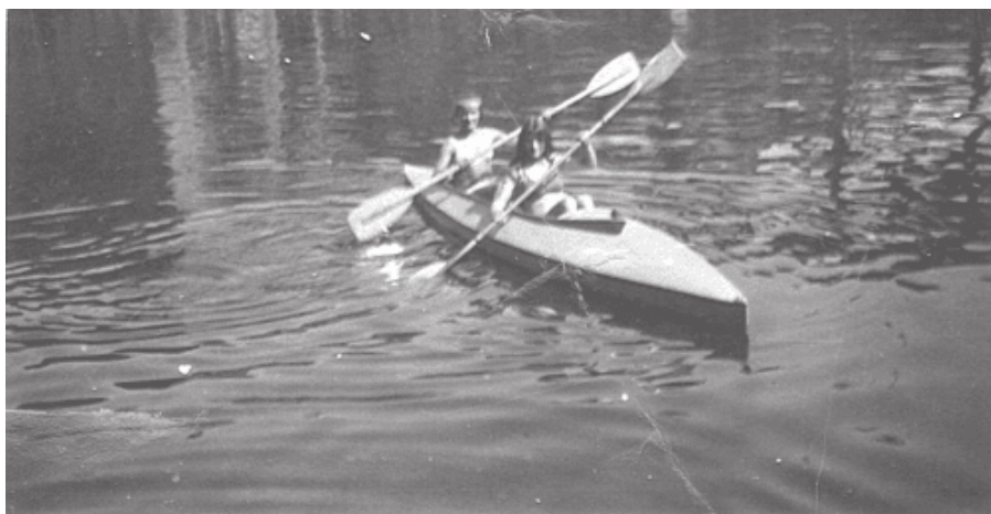
1. Wycieczka na kajakach