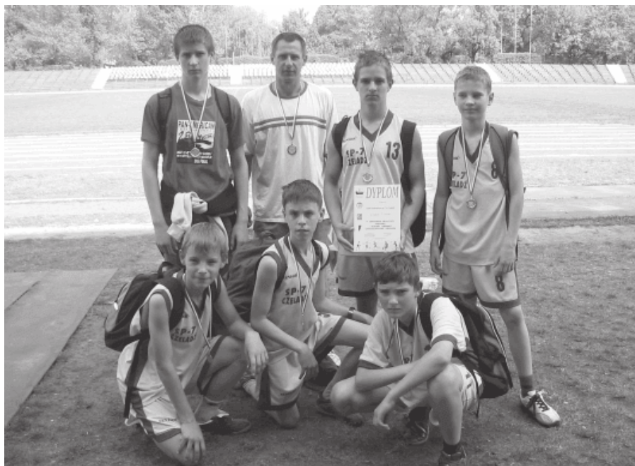
33. 2007 rok - 4 miejsce w czwórboju L.A. drużyny z SP 7.