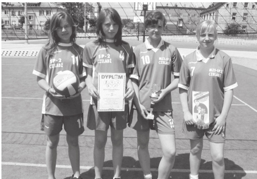
30. 2006 - 3 miejsce w siatkówce plażowej zespołu z SP 2