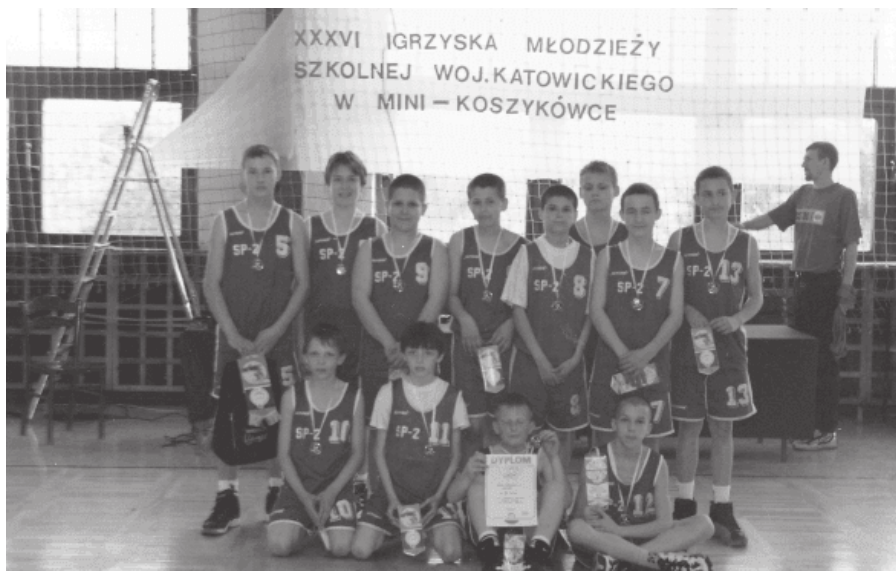
27. 1998 rok - 3 miejsce w mini koszykówce zespołu z SP 2

W Indywidualnych Mistrzostwach Szkół Podstawowych w Tenisie Stoło-