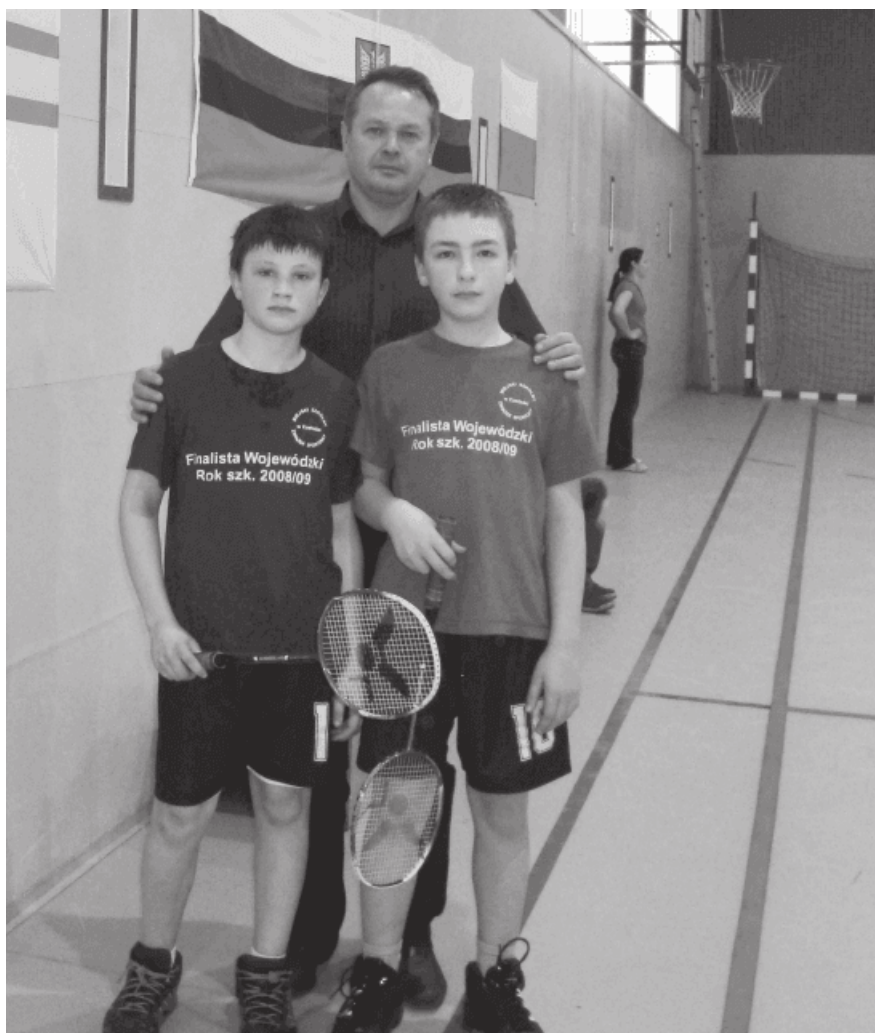
43. 2010 rok – 4 miejsce badminton zespół z SP 2.