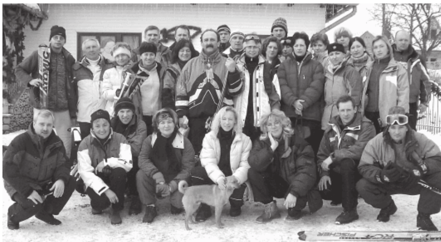
16. 2005 rok - warsztaty z narciarstwa alpejskiego

Dużą popularnością cieszą się organizowane przez MSZS w Czeladzi warsztaty z narciarstwa alpejskiego dla nauczycieli.