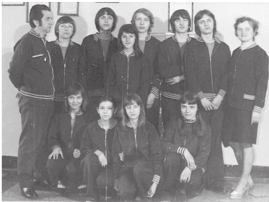
20. Zespół SKS z SP 1

Złoty krążek, łyżwiarstwo szybkie SP nr 1 to 10 miejsce w województwie. Szkoła Podstawowa nr 5 wywalczyła 11 miejsce w pływaniu. W XIV Wojewódzkich Zimowych Igrzyskach Szkolnych Zespół Szkół Zawodowych Ministerstwa Górnictwa i Energetyki z Czeladzi w klasyfikacji generalnej zajął 2 miejsce.