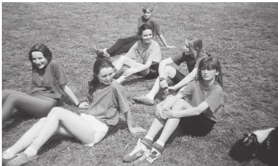
26. Zespół lekkoatletek z SP 1 podczas finału wojewódzkiego w Sosnowcu