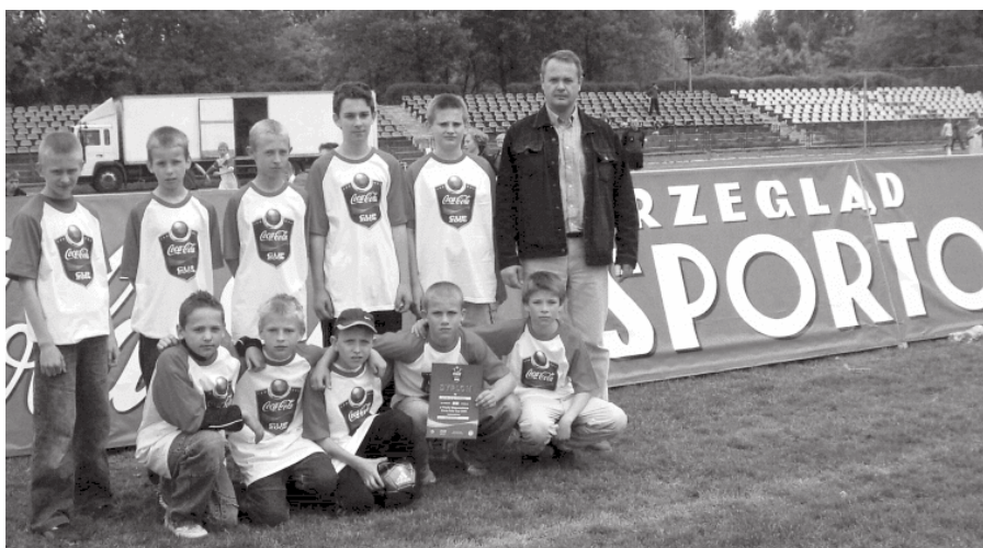
13. 2006 rok - Turniej Coca Cola Cup

Szkoły Podstawowe nr 2, 3, 7 uczestniczą i organizują turnieje Coca-Cola Cup w piłce nożnej. W 2006 roku Szkoła Podstawowa nr 2 jest organizatorem finału wojewódzkiego, w którym drużyna z tej szkoły zajęła 9 miejsce.