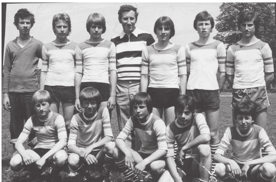
24. 1979 rok - drużyna piłkarzy z SP 4