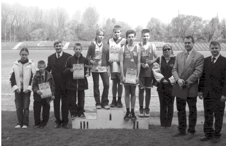
7. 2005 rok - Memoriał im. Józefa Pawelczyka

poprzez ścisły związek wychowania fizycznego z wychowaniem zdrowotnym, sportem i edukacją ekologiczną. Prowadzony i doskonalony od wielu lat system współzawodnictwa sportowego adresowany został do wszystkich uczniów w naszym mieście bez względu na wiek. Zdrowie, edukacja, wychowanie, powszechna aktywność ruchowa, sport oraz samorządność w działaniu stały się najważniejszym zadaniem wszystkich szkół i ogniw Szkolnego Związku Sportowego. Podstawowym szczeblem tego systemu była nadal szkoła i działający w niej Szkolny Klub Sportowy oraz Uczniowski Klub Sportowy. Upowszechniano Szkolne Igrzyska Sportowe, a w najmłodszych klasach szkół podstawowych Konkursy Gier i Zabaw. Kontynuowano systematyczną kontrolę indywidualnej sprawności i wydolności ucznia wg norm Indeksu Sprawności Fizycznej, Karty Sprawności Biegowej „Sprawdź się Sam”. Dzięki pozyskanym środkom finansowym zwiększono wykorzystanie zajęć rekreacyjnych dla grup dzieci rozwijających się prawidłowo, ale nie przejawiających zainteresowań sportowych. Ponownie upowszechniano konkursy: „Sport Dla Każdego”, „Zrobimy To Sami”, „Sport w Wyobraźni Dziecka”. Realizowano również wiele imprez z programu powszechnej aktywności ruchowej. Na stałe w mapę sportową Czeladzi wpisały się organizowane przez Zespół Szkół Specjalnych Mistrzostwa Śląska i Zagłębia w Tenisie Stołowym Osób Niepełnosprawnych.