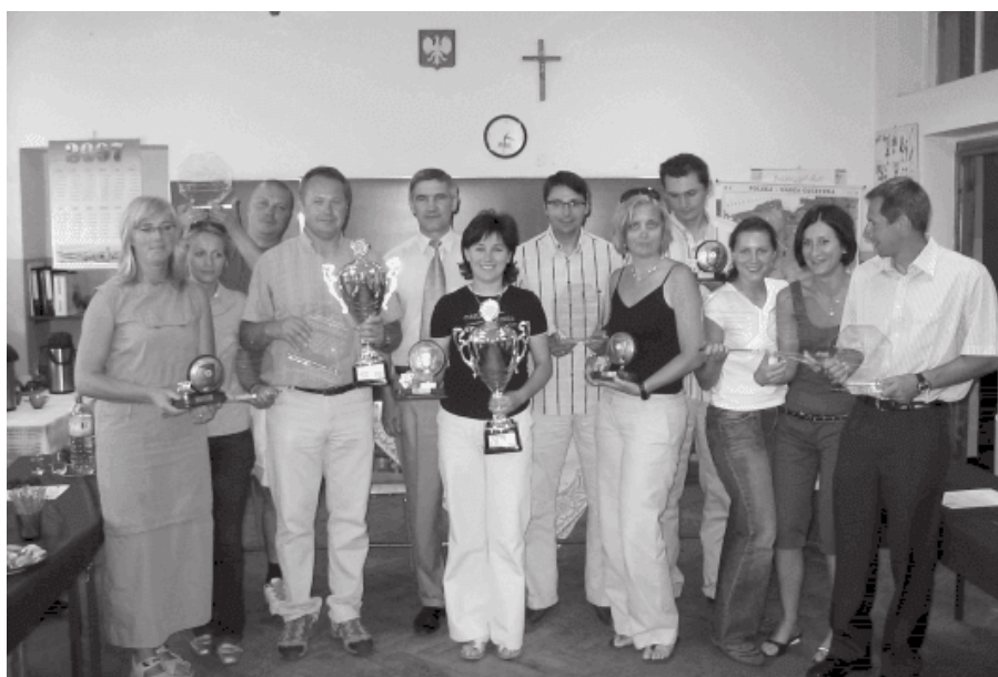
19. 2007 Sportowe zakończenie roku szkolnego i nagrodzeni nauczyciele w wieloboju sportowym nauczycieli