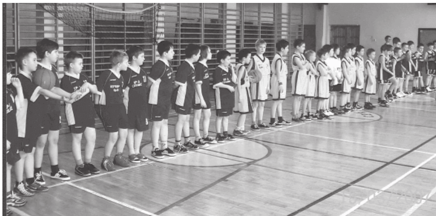
14. 2007 rok - turniej koszykówki dziecięcej klas 3

Ważnym przedsięwzięciem było rozpowszechnianie w klasach młodszych szkół podstawowych mini gier. Organizowano dla wszystkich szkół międzyszkolną ligę siatkówki dziecięcej dziewcząt i koszykówki dziecięcej chłopców dla klas I-III.