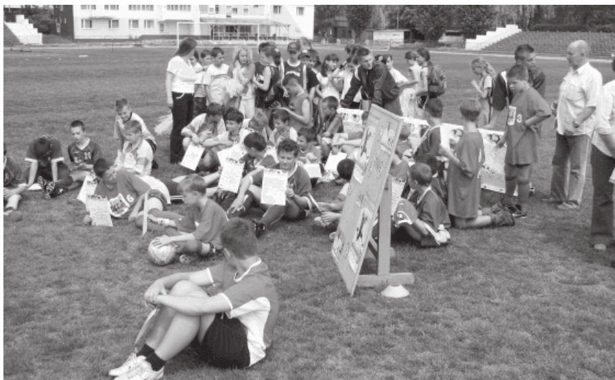
10. Imprezy sportowe „Zachowaj Trzeźwy Umysł”

Uczniowski Klub Sportowy „Omega Czeladź” organizuje dla dzieci i młodzieży Mistrzostwa Czeladzi w bowlingu i w narciarstwie alpejskim.