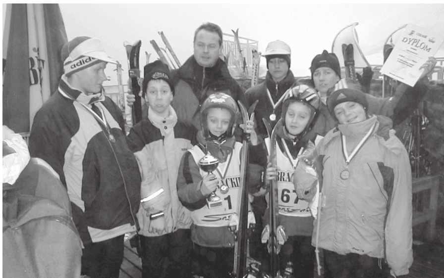
12. 2004 rok - Mistrzostwa Czeladzi w narciarstwie alpejskim Wisła Soszów

Szkoły Podstawowe nr 2, 3, 7 uczestniczą i organizują turnieje Coca-Cola Cup w piłce nożnej. W 2006 roku Szkoła Podstawowa nr 2 jest organizatorem finału wojewódzkiego, w którym drużyna z tej szkoły zajęła 9 miejsce.