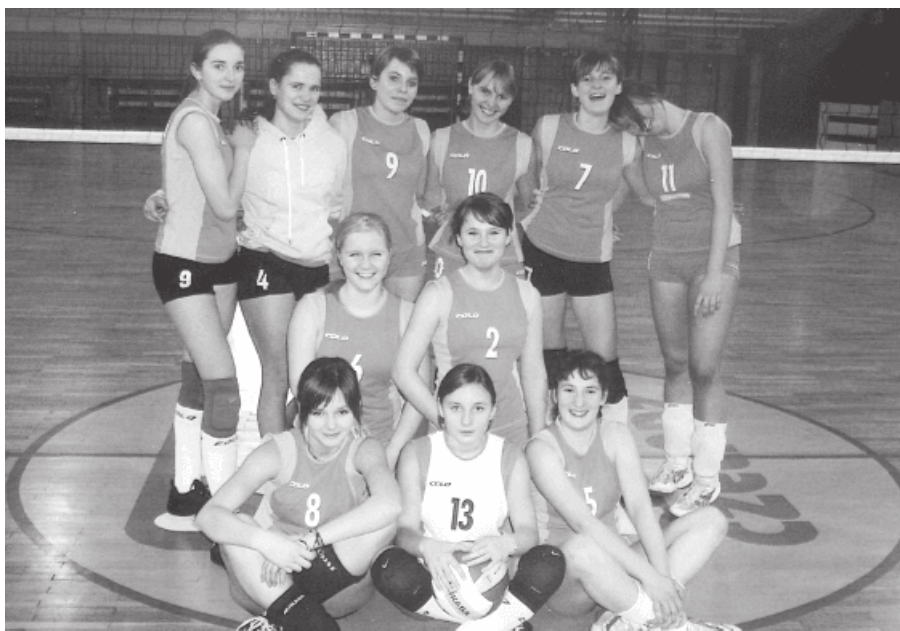
32. 2007 rok - 5-8 miejsce w siatkówce zespołu z G1.