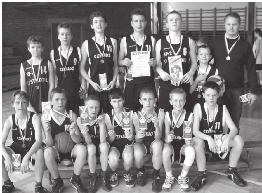
29. 2005 - 2 miejsce w mini koszykówce drużyny z SP 2