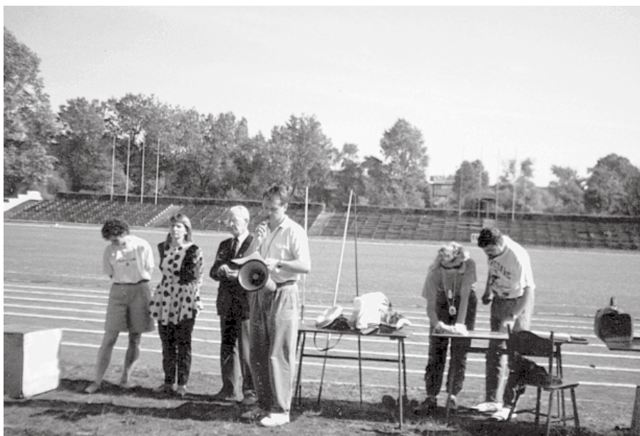
3. 1992 rok - Puchar im. Józefa Pawełczyka

Podstawowym celem było zwiększenie aktywności fizycznej młodego pokolenia, ze szczególnym zwróceniem uwagi na aspekt zdrowotny i sprawnościowy. Od 1992 roku dla spopularyzowania lekkiej atletyki i uhonorowania dokonań trenerskich organizowano Puchar im. Józefa Pawełczyka.