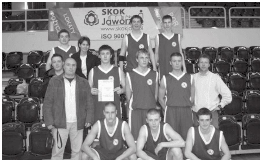
36. 2008 rok – 9-12 miejsce w koszykówce drużyny z ZS 1.