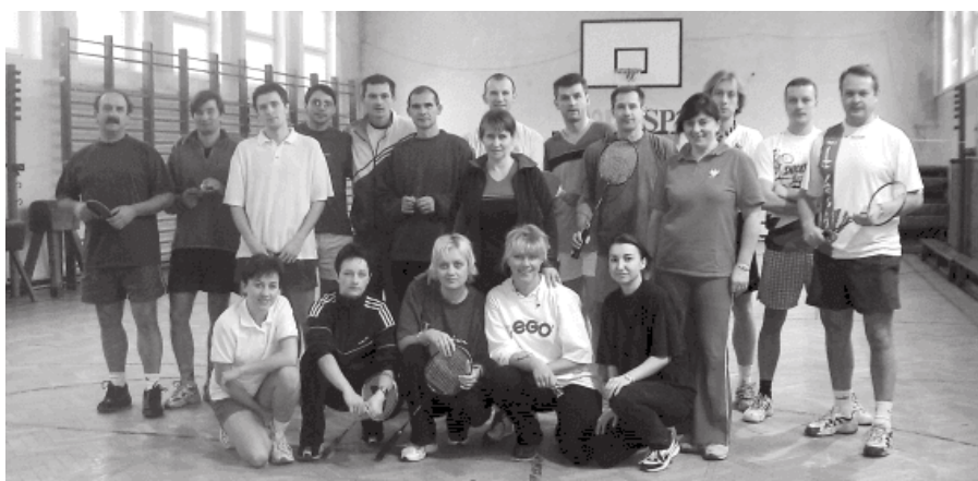
15. 2004 rok - wielobój nauczycieli

Ciekawym pomysłem było zorganizowanie przez Miejski Szkolny Związek Sportowy wspólnie ze Związkiem Nauczycielstwa Polskiego współzawodnicstwa sportowego nauczycieli w wielu dyscyplinach m. in w: tenisie ziemnym, badmintonie, tenisie stołowym, narciarstwie alpejskim, szachach, pływaniu, lekkiej atletyce, bowlingu, rzutkach, strzelectwie.